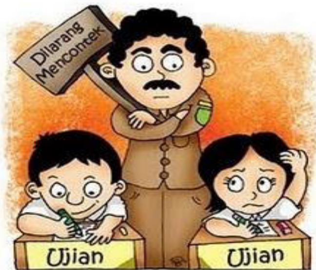
Gambar VI.1: Tidak mencontek merupakan salah satu etika dalam melaksanakan ujian sekolah