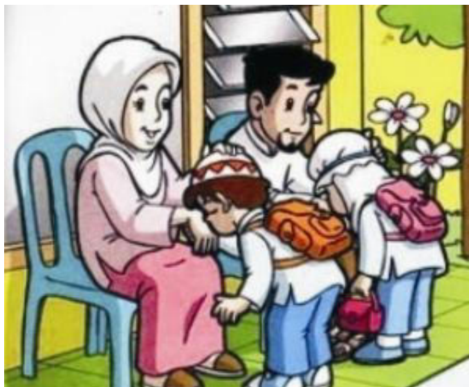
Gambar VI.2: Meminta doa restu orang tua merupakan salah satu etika sebelum berangkat sekolah