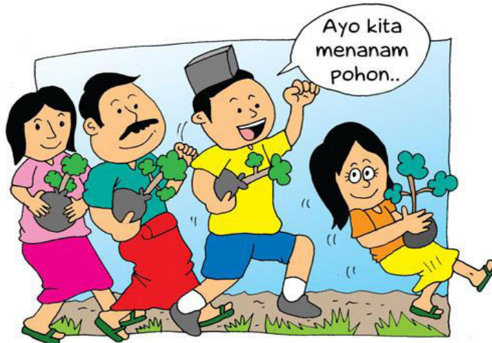
Gambar VI.7: Menanam pohon sebagai bentuk kesadaran atas lingkungan hidup yang asri.

Lingkungan hidup yang nyaman melahirkan generasi muda yang sehat dan bersih sehingga kehidupan bermasyarakat, berbangsa, dan bernegara menjadi lebih bermakna sebagaimana tercermin dalam gambar berikut.