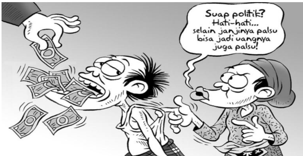
Gambar VI.4: Salah satu etika dalam berdemokrasi adalah menolak berbagai macam bentuk suap dalam proses pemilihan wakil-wakil rakyat.

Etika Pancasila diperlukan dalam kehidupan bermasyarakat, berbangsa, dan bernegara sebab berisikan tuntunan nilai-nilai moral yang hidup. Namun, diperlukan kajian kritis-rasional terhadap nilai-nilai moral yang hidup tersebut agar tidak terjebak ke dalam pandangan yang bersifat mitos. Misalnya, korupsi terjadi lantaran seorang pejabat diberi hadiah oleh seseorang yang memerlukan bantuan atau jasa si pejabat agar urusannya lancar. Si pejabat menerima hadiah tanpa memikirkan alasan orang tersebut memberikan hadiah. Demikian pula halnya dengan masyarakat yang menerima sesuatu dalam konteks politik sehingga dapat dikategorikan sebagai bentuk suap, seperti contoh berikut: