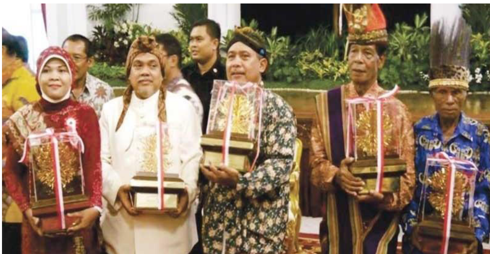
Gambar VI.6: Penerima penghargaan Kalpataru sebagai bentuk apresiasi pemerintah terhadap pemerhati lingkungan.

Kelima , kerusakan lingkungan yang berdampak terhadap berbagai aspek kehidupan manusia, seperti kesehatan, kelancaran penerbangan, nasib generasi yang akan datang, global warming , perubahan cuaca, dan lain sebagainya. Kasus-kasus tersebut menunjukkan bahwa kesadaran terhadap nilai-nilai Pancasila sebagai sistem etika belum mendapat tempat yang tepat di hati masyarakat. Masyarakat Indonesia dewasa ini cenderung memutuskan tindakan berdasarkan sikap emosional, mau menang sendiri, keuntungan sesaat, tanpa memikirkan dampak yang ditimbulkan dari perbuatannya. Contoh yang paling jelas adalah pembakaran hutan di Riau sehingga menimbulkan kabut asap. Oleh karena itu, Pancasila sebagai sistem etika perlu diterapkan ke dalam peraturan perundang-undangan yang menindak tegas para pelaku pembakaran hutan, baik pribadi maupun perusahaan yang terlibat. Selain itu, penggiat lingkungan dalam kehidupan bermasyarakat, berbangsa, dan bernegara juga perlu mendapat penghargaan seperti gambar berikut.