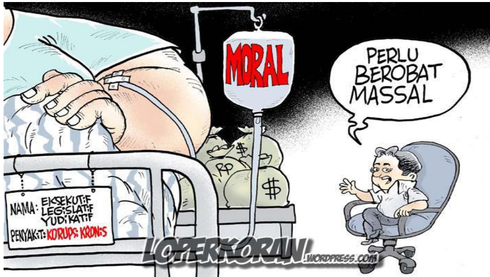
Gambar VI.3: Korupsi merupakan penyakit moral yang kronis yang perlu disembuhkan.