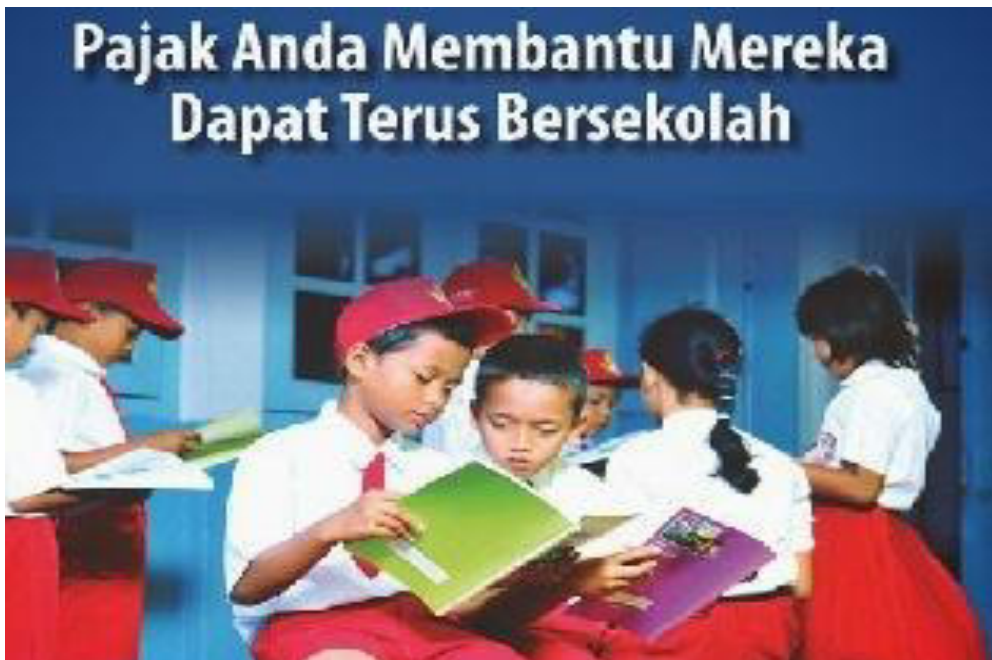
Gambar VI.5: Pajak yang telah dibayar oleh masyarakat salah satunya digunakan untuk membiayai pendidikan di Indonesia, membangun gedung sekolah, mendanai Bantuan Operasional Sekolah, maupun untuk membeli buku-buku pelajaran agar jutaan anak Indonesia dapat terus bersekolah. (Sumber: www.pajaglempung.com )

Ketiga , kurangnya rasa perlu berkontribusi dalam pembangunan melalui pembayaran pajak. Hal tersebut terlihat dari kepatuhan pajak yang masih rendah, padahal peranan pajak dari tahun ke tahun semakin meningkat dalam membiayai APBN. Pancasila sebagai sistem etika akan dapat mengarahkan wajib pajak untuk secara sadar memenuhi kewajiban perpajakannya dengan baik. Dengan kesadaran pajak yang tinggi maka program pembangunan yang tertuang dalam APBN akan dapat dijalankan dengan sumber penerimaan dari sektor perpajakan. Berikut ini diperlihatkan gambar tentang iklan layanan masyarakat tentang pendidikan yang dibiayai dengan pajak.